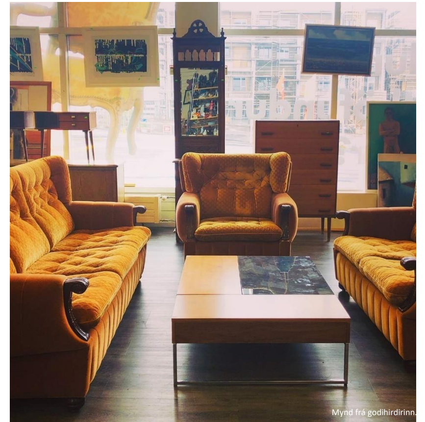
Mynd frá godihirðirinn.