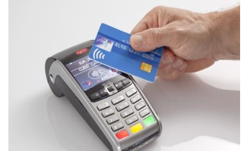
This Photo is licensed under CC BY-SA-NC